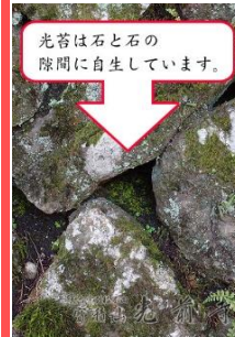
光苔は石と石の 隙間に自生しています。

光前寺で飼われていた、早太郎。遠 州の怪物(ヒビ)と戦い村を救った早 太郎は傷をおいながらもやっと光前 寺までたどり着くと和尚さんに怪物退 治を知らせるかのようにな声高く吠 えて息をひきとってしまいました。本堂 の横に早太郎のお墓があります。