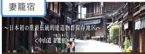
~日本初の重要伝統的建造物群保存地区~ <中山道 妻籠宿>