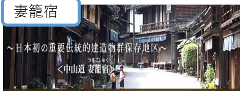
～日本初の重要伝統的建造物群保存地区～ <中山道 妻籠宿>